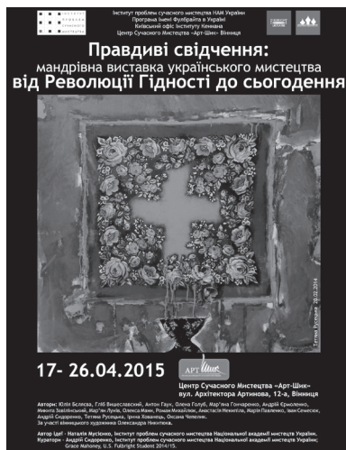
Афіша виставки в Вінниці. Автор Мар'ян Лунів