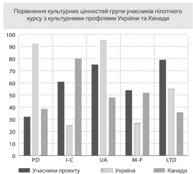
Рис. 2. Зіставлення культурного профілю групи учасників проекту з усередненими національними профілями України та Канади

Культура може бути оцінена лише у порівнянні, тому ми зіставили отриманий груповий культурний профіль учасників групи з національними профілями країн-учасниць проекту – України й Канади 2 (рис. 2).